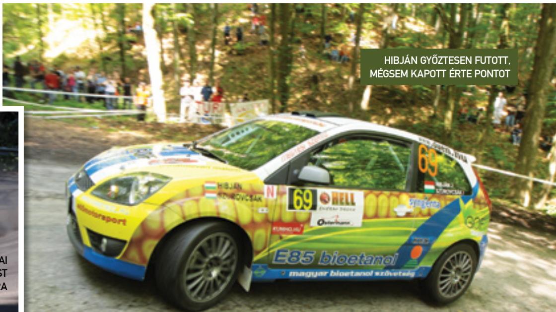
HIBJÁN GYŐZTESEN FUTOTT, MÉGSÉM KAPOTT ÉRTE PONTOT