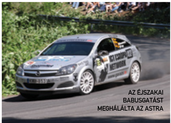
AZ ÉJSZAKAI BABUSGATÁST MEGHÁLÁLTA AZ ASTRA

A hivatalosan kiadott listán 9-en szerepeltek (!), mégis csupán 3-an maradtak! Vajon, milyen vész ütötte fel fejét?