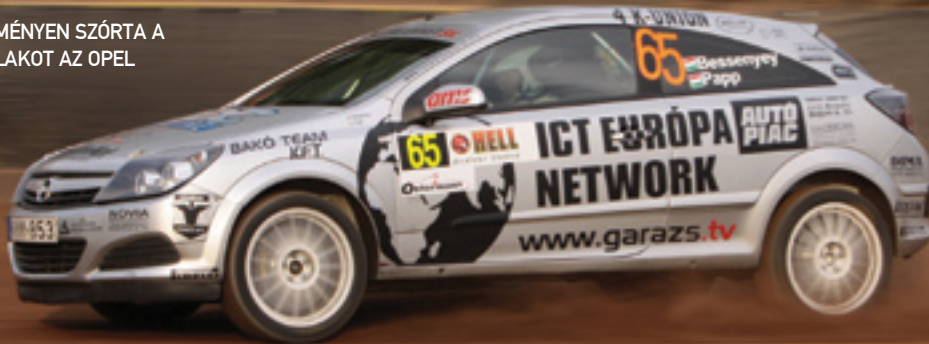
KEMÉNYEN SZÓRTA A SALAKOT AZ OPEL